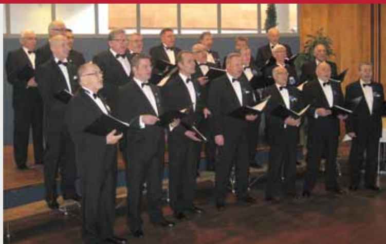
Kurikan Nuijamiehet keväällä 2011 Kankaanpäässä

Malmilaisten kollegojensa tapaan myös kurikkalaiset tullevat kuoron jatkuvuutta varmistaakseen mm. laventamaan lauluvalikoimaansa kevyempään ja jopa tanssilliseen suuntaan.