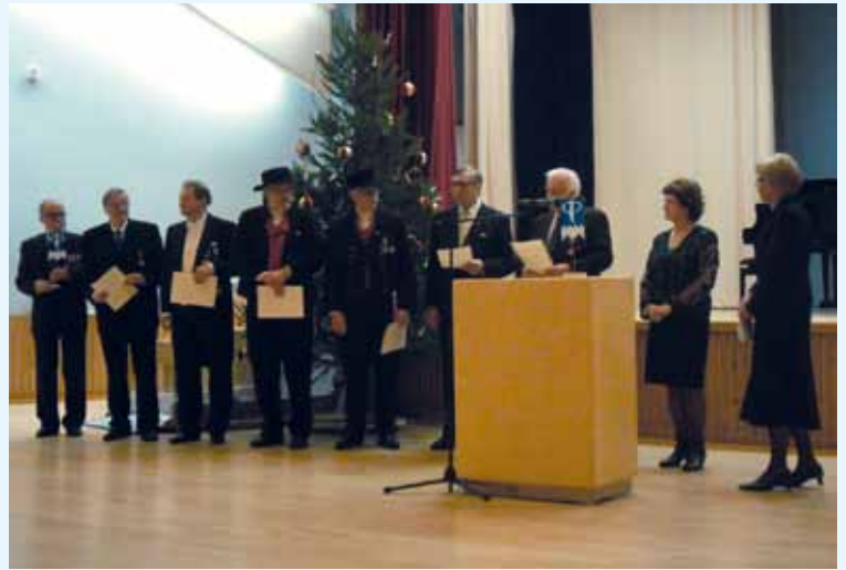
Juhlissa muistettiin pitkään yhdistyksen toiminnassa mukana olleita.