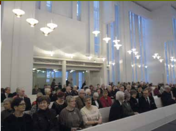
Myyrmäen kirkko täyttyi sanankuulijoista.