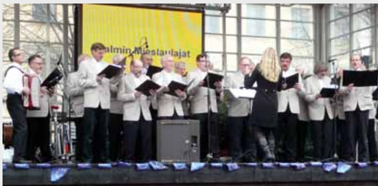
Malmin Mieslaulajat Eurooppa-päivänä 2010 Espan lavalla