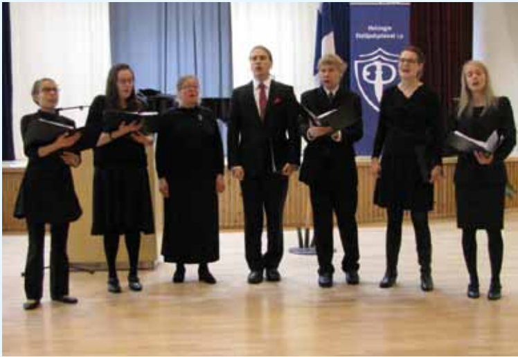
Pohjalaisten Osakuntien kuoron vahvistettu kvartetti esiintyi.